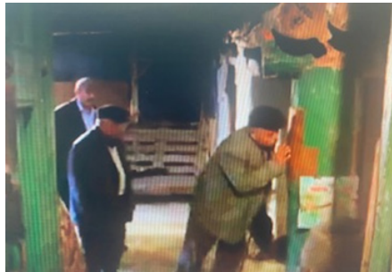
Şekil 4: Cemevine Girişte Kapı Niyazı.

Alevi Bektaşî inancında insan mutlaka eğitilmesi, olgunlaştırılması gereken bir varlıktır. Bu amaçla insanı olgunlaştırmaya yönelik olarak "Dört Kapı Kırk Makam" öğretisi geliştirilmiştir. Bu şekilde insan olgunlaştırılarak topluma yararlı bir birey haline getirilir. Bu öğretilerdeki kurallar, insanın gönül dünyasına hitap eden ve ruhsal yolculuğunu destekleyen adımlardan