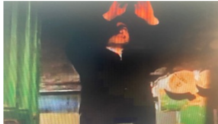
Şekil 2: Cemevine Girişte Eşik Niyazi.

Zelyut'a göre, Alevîler özel ibadet toplantıları yapmaya İmam-ı Cafer Sadık döneminde başlamışlardır. Bu toplantılar ilk cemler olarak kabul edilmiştir (Zelyut, 1992, s. 69). Cem ayini miraç hadisesinden sonra Kırklar Meclisi'nde yaşananların ve bu mecliste bulunan zatların sembolik şekilde temsil edildiği bir ayin ve onun yeryüzündeki tekrarıdır. Bu sebeple o meclisi temsile vesile olacak her şeyi yapmak ibadetin bir gereğidir. Ayinin icra edildiği Kırklar Meydanı'nın eşığı, Hz. Ali'yi, yani yola girişi temsil etmektedir. Bu sebeple eşikten başlayarak bu mekânın bütünü kutsaldır ve saygıdeğerdir. Böylece cem, iman ile amelin, akide ile geleneksel merasimlerin bir araya getirildiği ayinler yumağıdır (Yörükân, 1998, s. 131).