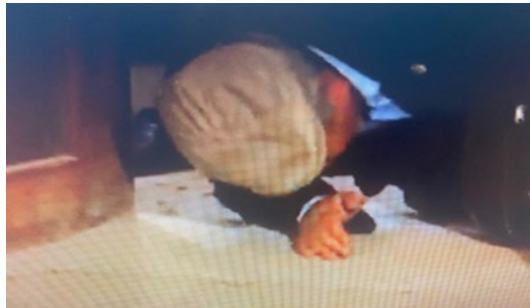
Şekil 1: Cemevine Girişte Eşik Niyazı