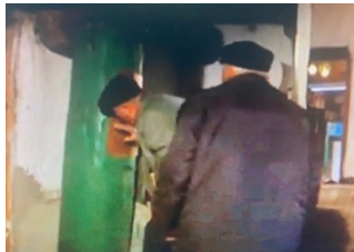
Şekil 3: Cemevine Girişte Kapı Niyazı.

Alevi-Bektaşî inanç ve kültürünün temel öğelerden bir olduğu anlaşılan kapı kavramının kelime ve içerik açısından incelediğinde çok geniş bir karşılığının olduğu görülmektedir. Alevilik ve Bektaşilikte kapı kavramına yüklenen ilk anlam onun yola girmeyi ifade etmesidir. Kapı bu inançta, zahirî ve batınî ilme işaret eden bir şeriat noktasıdır. Kapının iki kanadı Hasan ile Hüseyin'e, kapının eşığı ise tarikatın ilk basamağına işaret eder. Aynı zamanda eşik, mahviyet yolunun başlangıcı ve sırat-ı müstakimdir. Bu yüzden cem erkânı esnasında eşik, çiğnenmez aksine ona yedi aza ile niyaz edilir. Ayinin yapılacağı erenlerden kalan meydanın kapısı doğudadır ve bu nokta diğer yönlerin adlandırılmasında kıstas alınır. Şeriat olarak görülen giriş kapısına arka çevirmek günahdır. Bütün kâinatı temsil ettiği düşünülen meydana giriş şeriat kapısından çıkış erkân kapısındanadır.